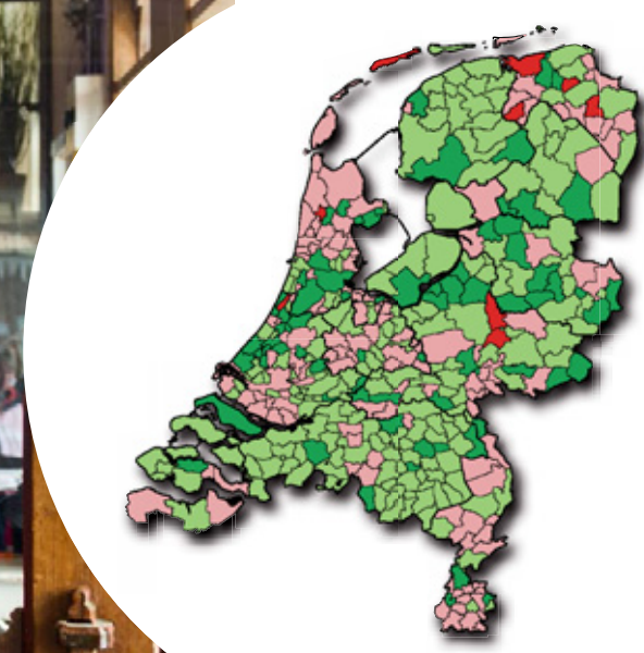
De Fietskaart wordt onthuld met fietsinspanningen van gemeenten.