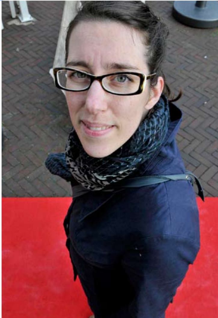
rode loper dag prénatal

Filmster "Ik hou erg van de rockabilly-stijl. Dat gaat wel verder dan films."